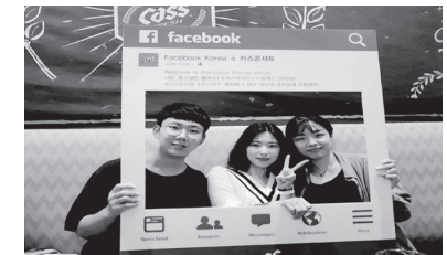
· 회사에서 주최한 비어마스터클래스 참여