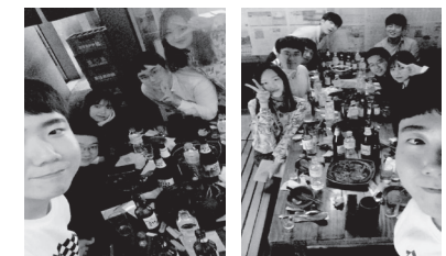
· 인턴 친구들과 회식