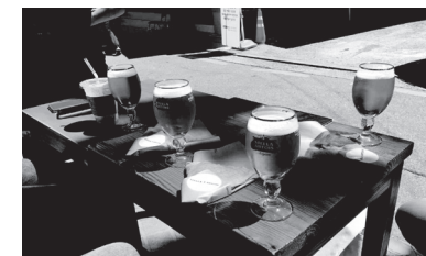
· 회사 제품 '스텔라아르투아' 마켓비즈 참여