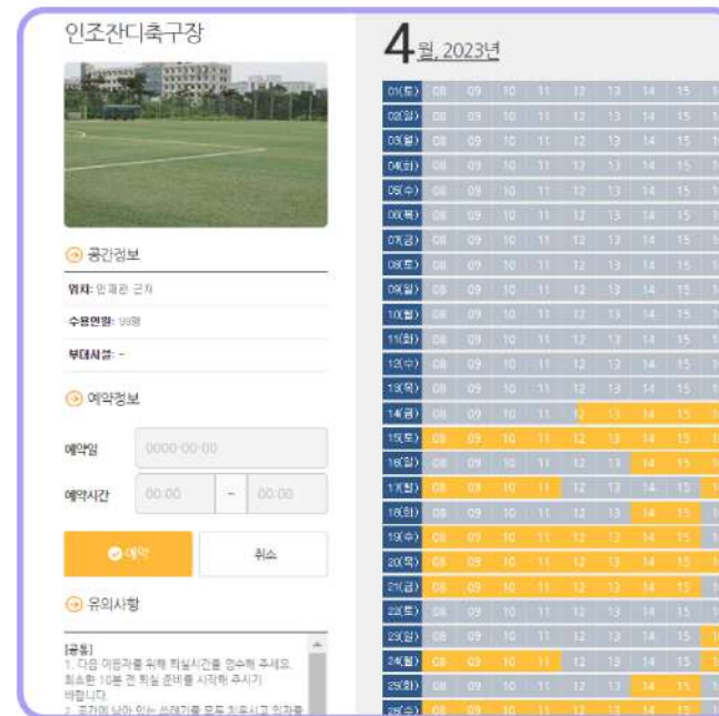
2. 반드시 공통 / 개별 유의사항 및 예약 가능 시간 확인 후 예약 정보 (예약일, 예약 시간) 입력